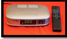
وحدة تحريك أوتوماتيكية